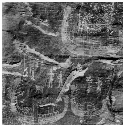
Fig. 4 The king and royal entourage in Tableau 7a, restored on the basis of the photographs of Dr. Labib Habachi.

1. Monsieur le Professeur A. H. SAYCE a bien voulu nous communiquer les graffiti qu'il avait lui-même recueillis sur les deux rives du Nil entre Assouan et Kom-Ombos.